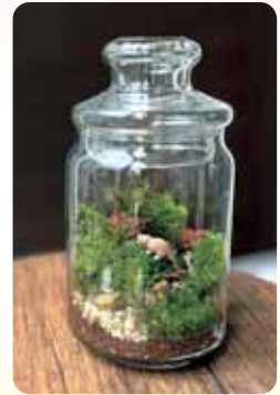
イメージ(材料が異なる場合があります) 直径約9cm高さ12cm(蓋含む)