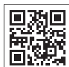
・アソビュー！公式サイト豊富なコンテンツを検索!!