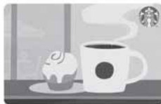
※カードのデザインは未定