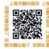
市観光協会 ホームページ