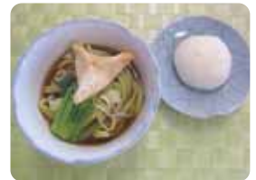
郷土料理実習 「アッピーグリーンヒミツうどん、小麦まんじゅう」